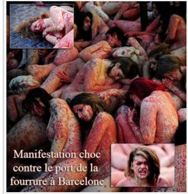
Manifestation choc contre le port de la fourrure à Barcelone